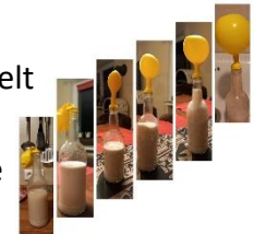
Gärversuch mit Hefepilzen

fundiertem Fachwissen und einladenden Materialien und Versuchen in die Welt der Pilze mit. Im Anschluss an die Vorlesung nahmen die 8-12-jährigen Kinder gerne das Angebot wahr, echte Pilze zu untersuchen. Die Veranstaltungsreihe „Kinder-Uni“ wird organisiert von der VHS Lüdinghausen und wird von zahlreichen Institutionen unterstützt.